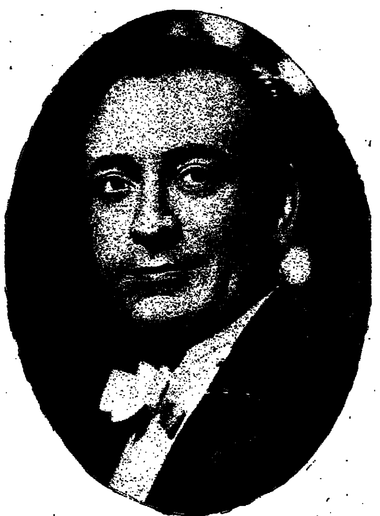
صورة من الأرشيف الفنان: محمود الميجي.. ايام زمان